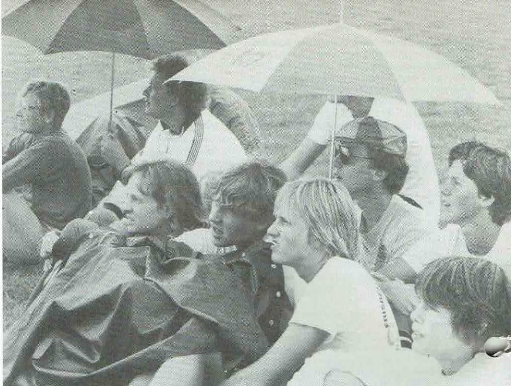
Vissa stunder var det riktigt blött. Västervikarna kollar SCF-finalisterna från skyddade positioner.