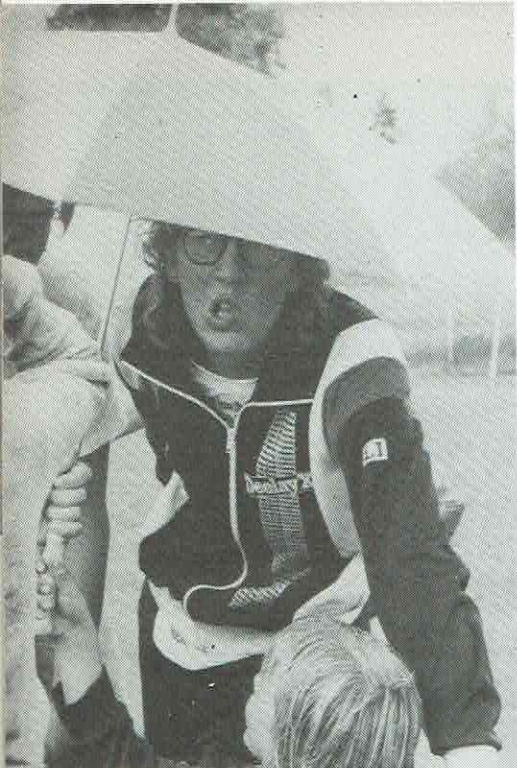
Konkurrenternas kast bevakades noga under SCF-finalen.